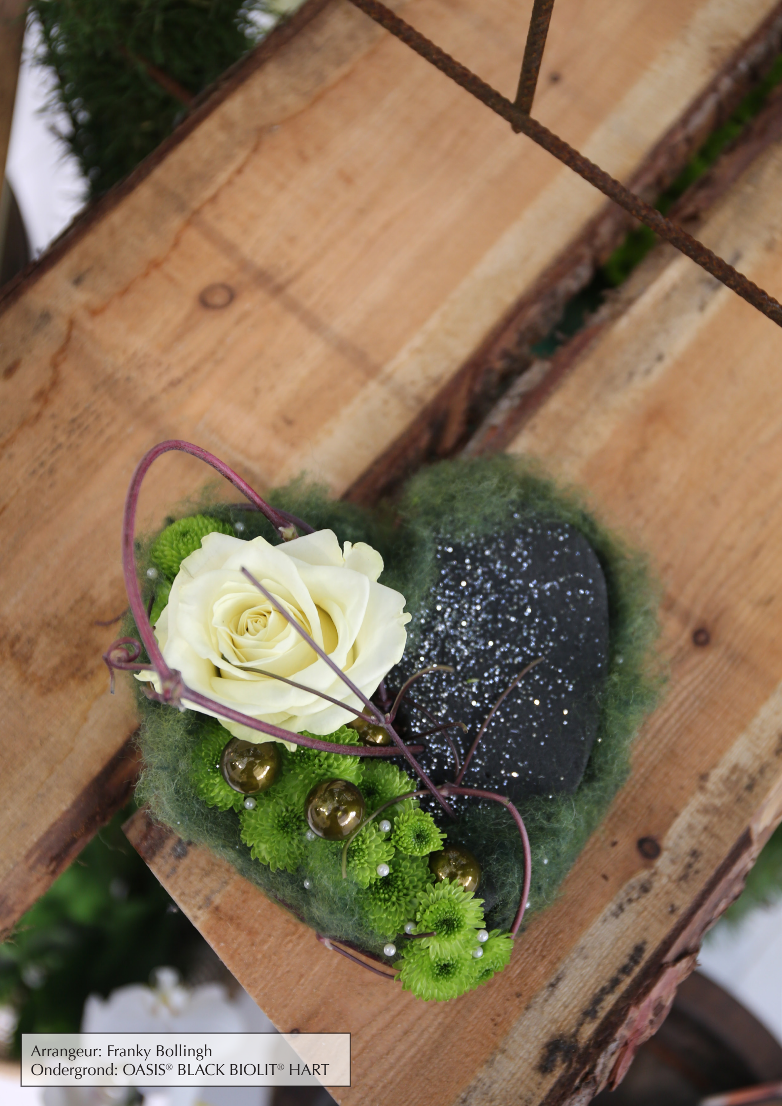
Arrangeur: Franky Bollingh Ondergrond: OASIS® BLACK BIOLIT® HART