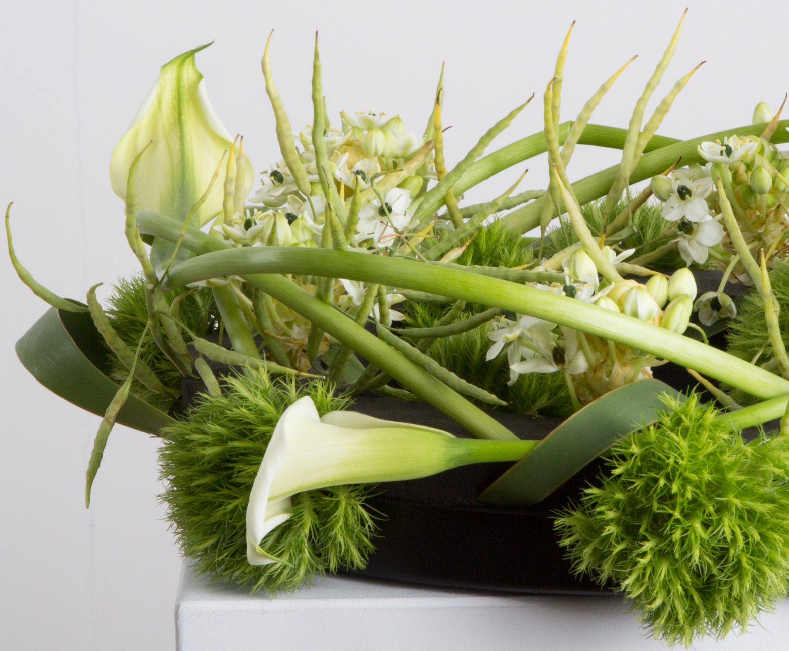
Arrangeur: Pim Van Den Akker Ondergrond: OASIS® BLACK DESIGN RING