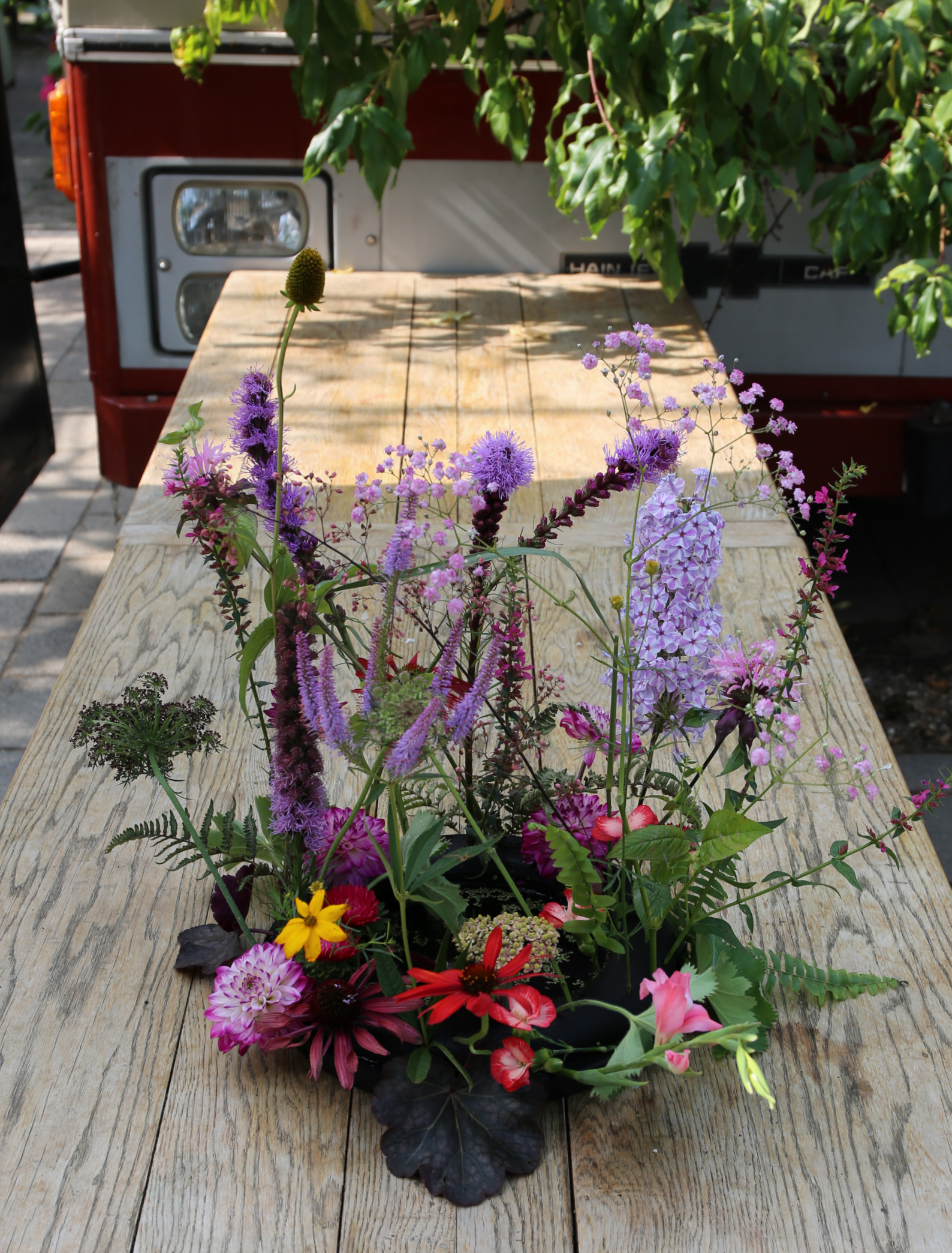
Arrangeur: Lucinda Van Der Ploeg Ondergrond: OASIS® BLACK NAYLORBASE® RING