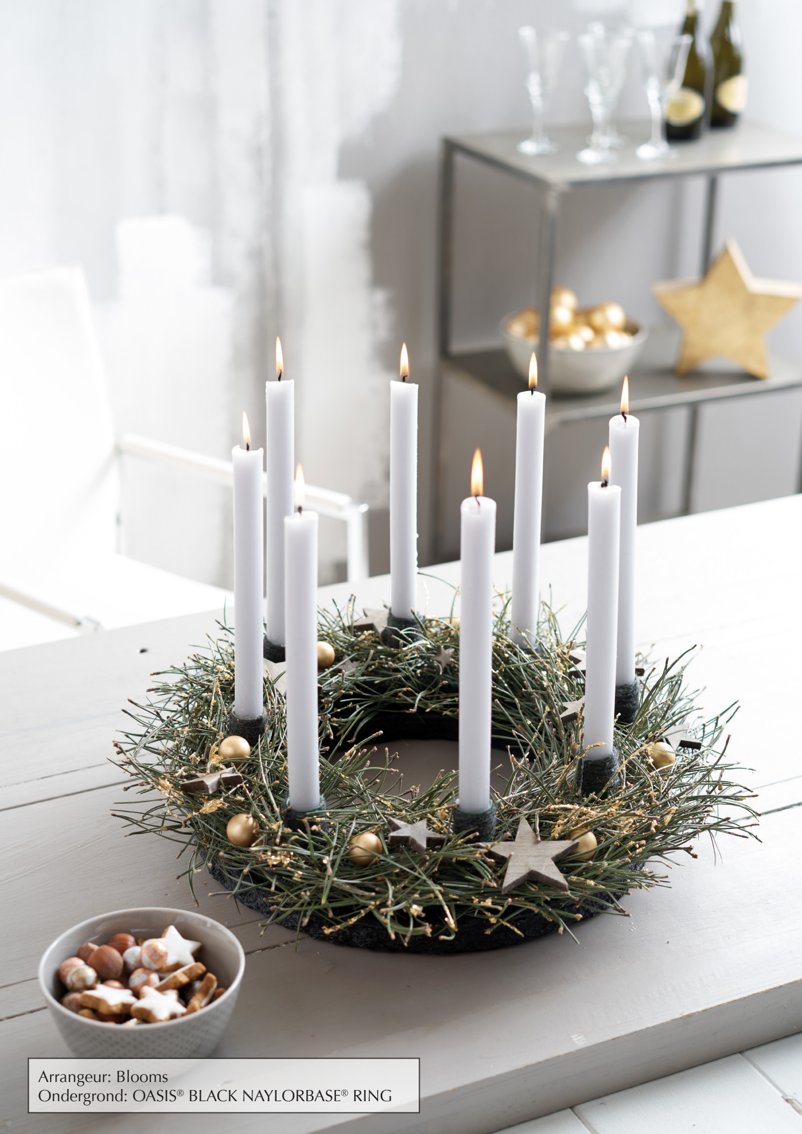
Arrangeur: Blooms Ondergrond: OASIS® BLACK NAYLORBASE® RING