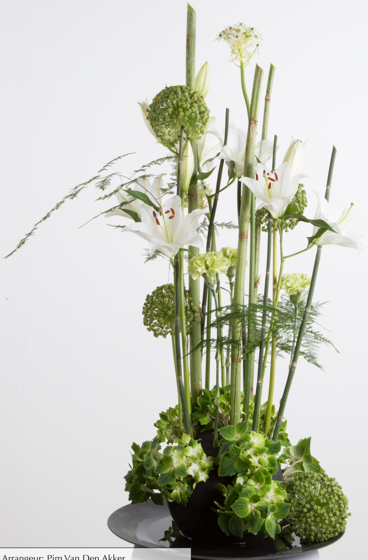
Arrangeur: Pim Van Den Akker Ondergrond: OASIS® BLACK IDEAL SPHERE