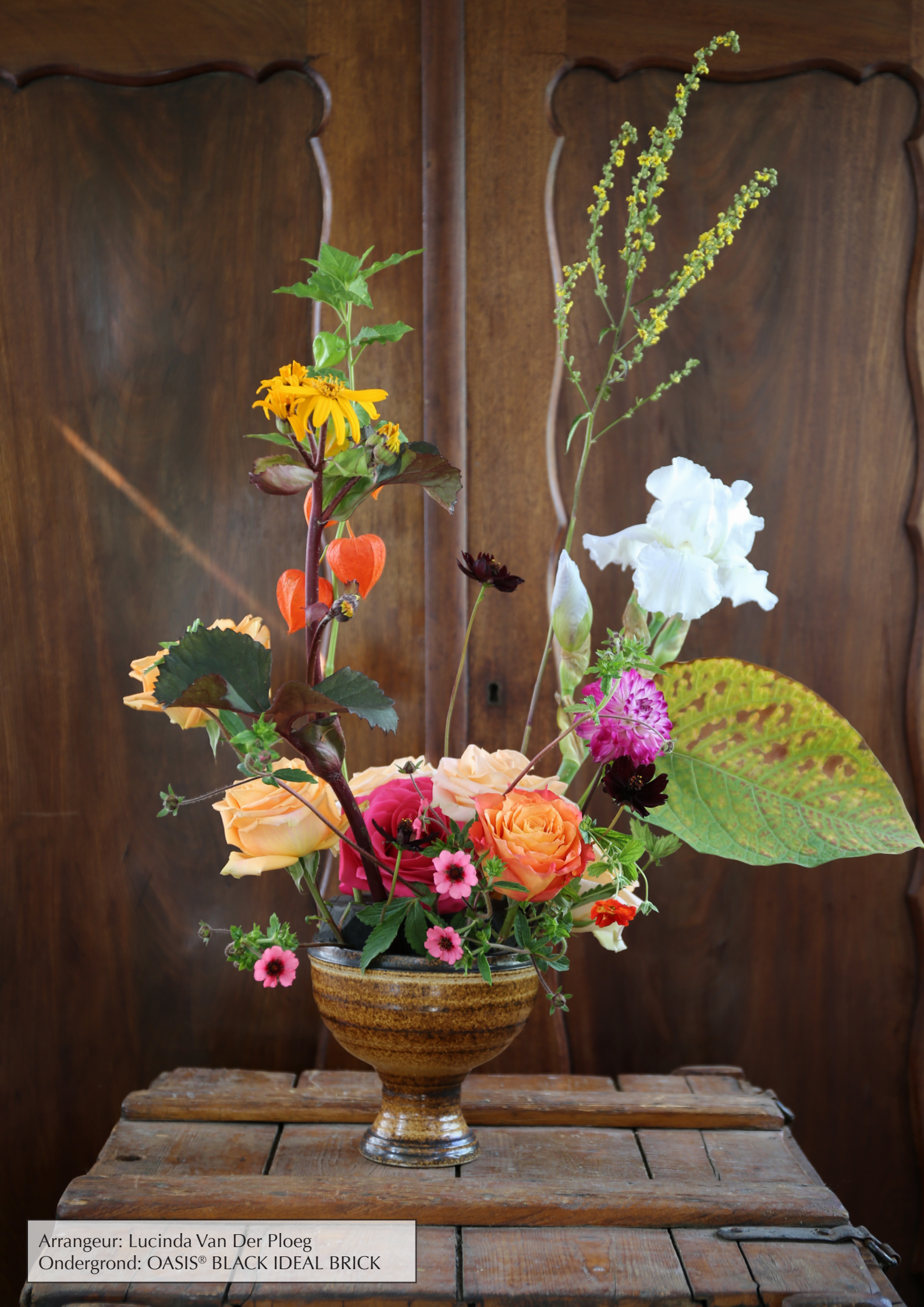
Arrangeur: Lucinda Van Der Ploeg Ondergrond: OASIS® BLACK IDEAL BRICK