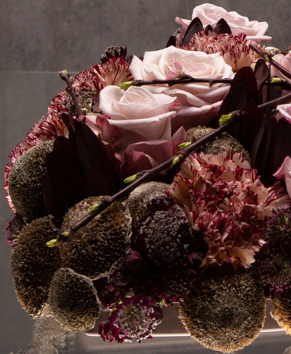
Arrangeur: Roos van Unen Ondergrond: OASIS® BLACK BIOLIT® HART