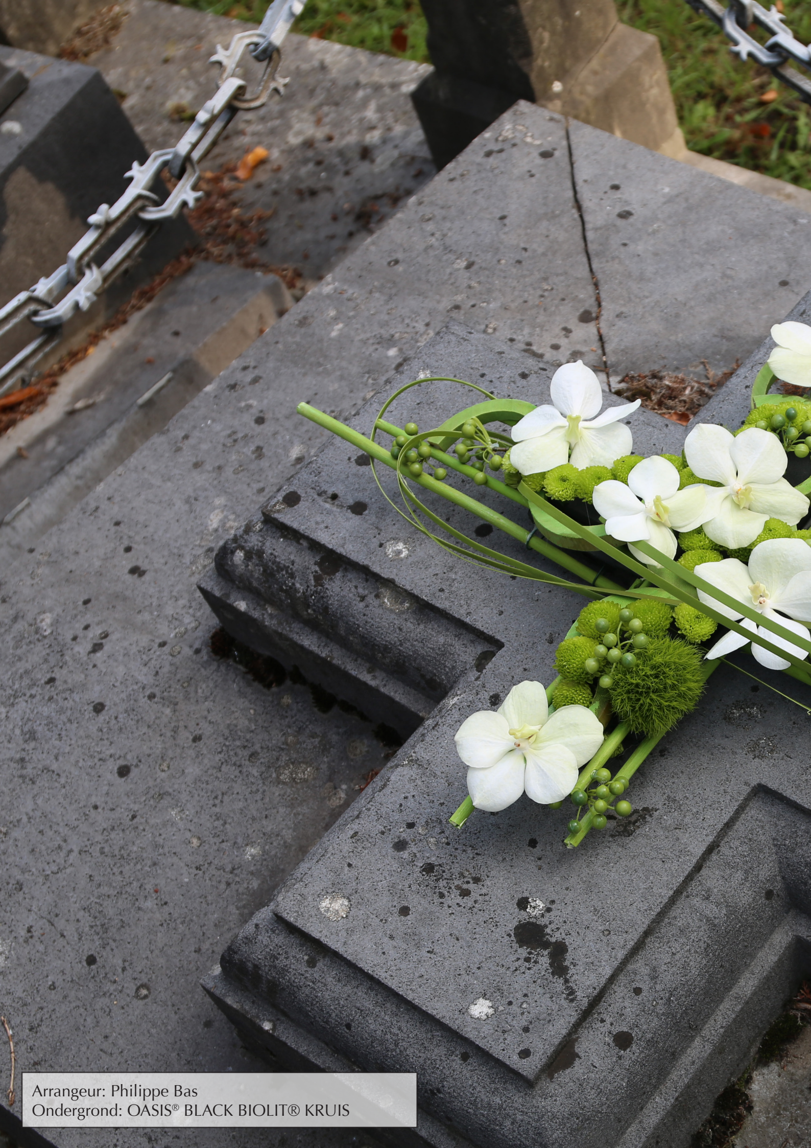
Arrangeur: Philippe Bas Ondergrond: OASIS® BLACK BIOLIT® KRUIS