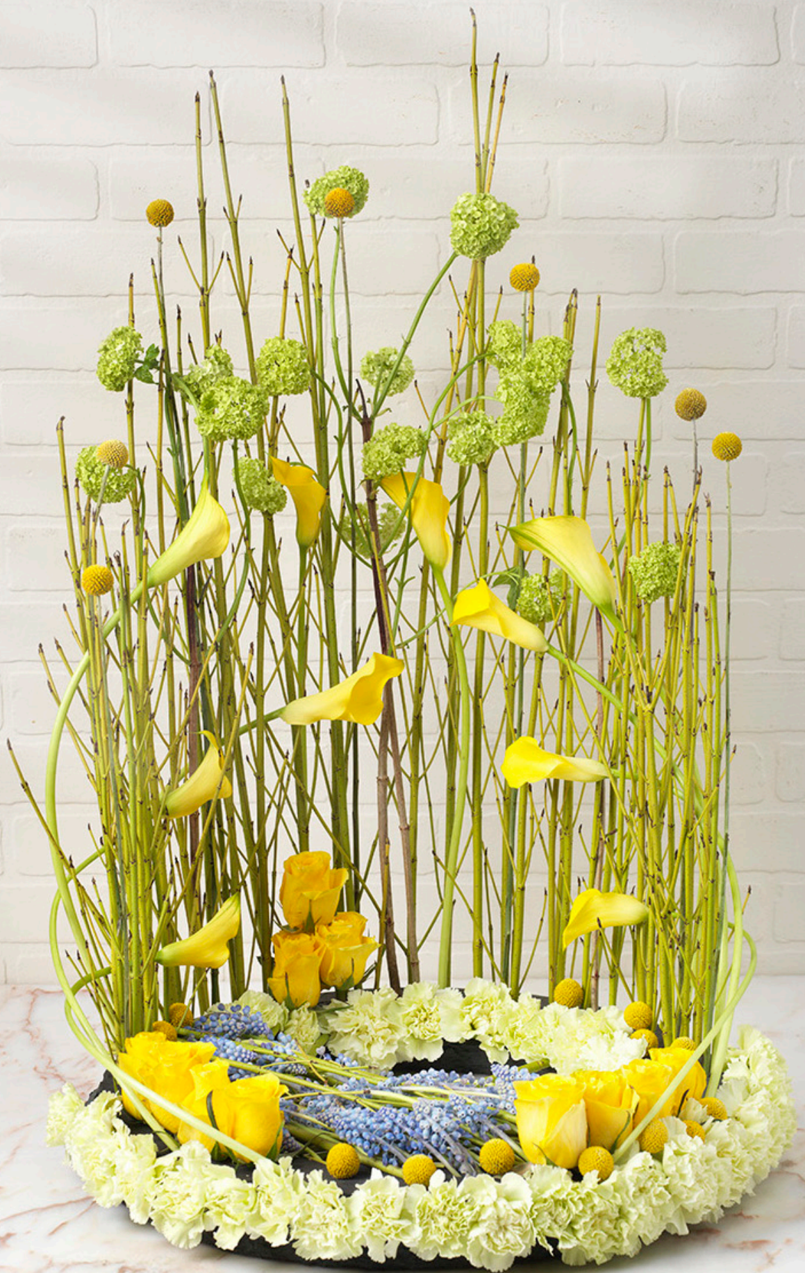
Arrangeur: Helen Jamieson Ondergrond: OASIS® BLACK NAYLORBASE® RING