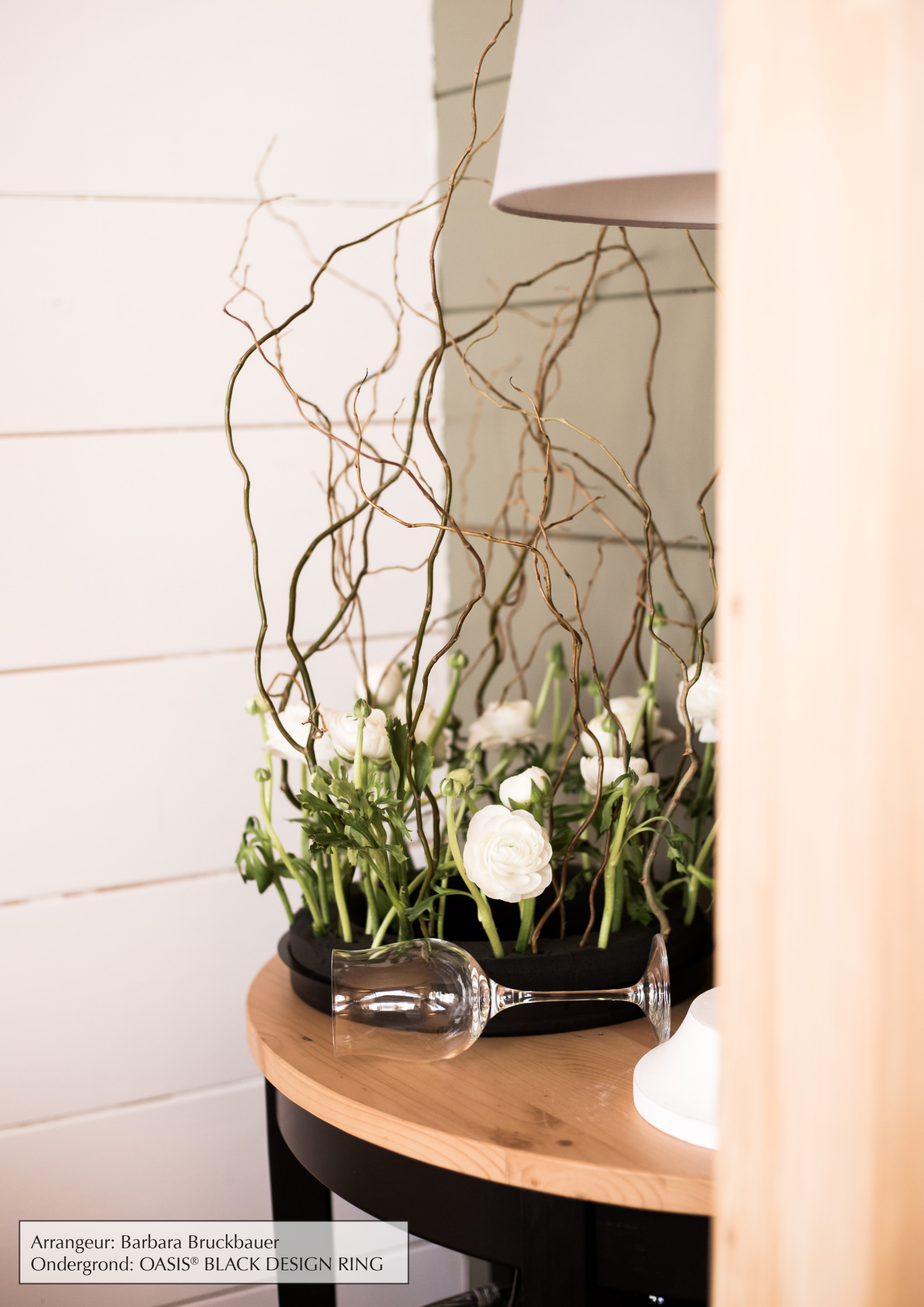
Arrangeur: Barbara Bruckbauer Ondergrond: OASIS® BLACK DESIGN RING