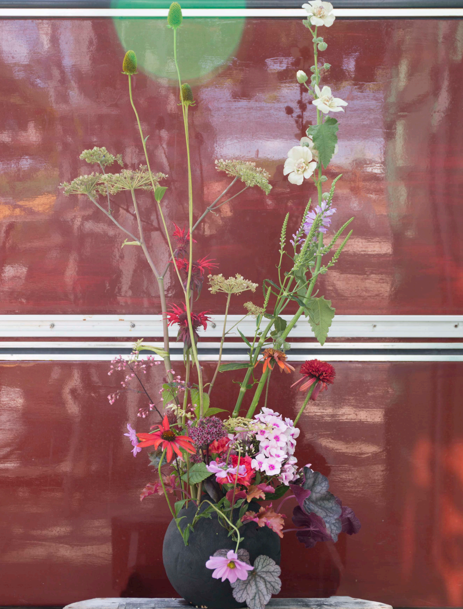
Arrangeur: Lucinda Van Der Ploeg Ondergrond: OASIS® BLACK IDEAL SPHERE