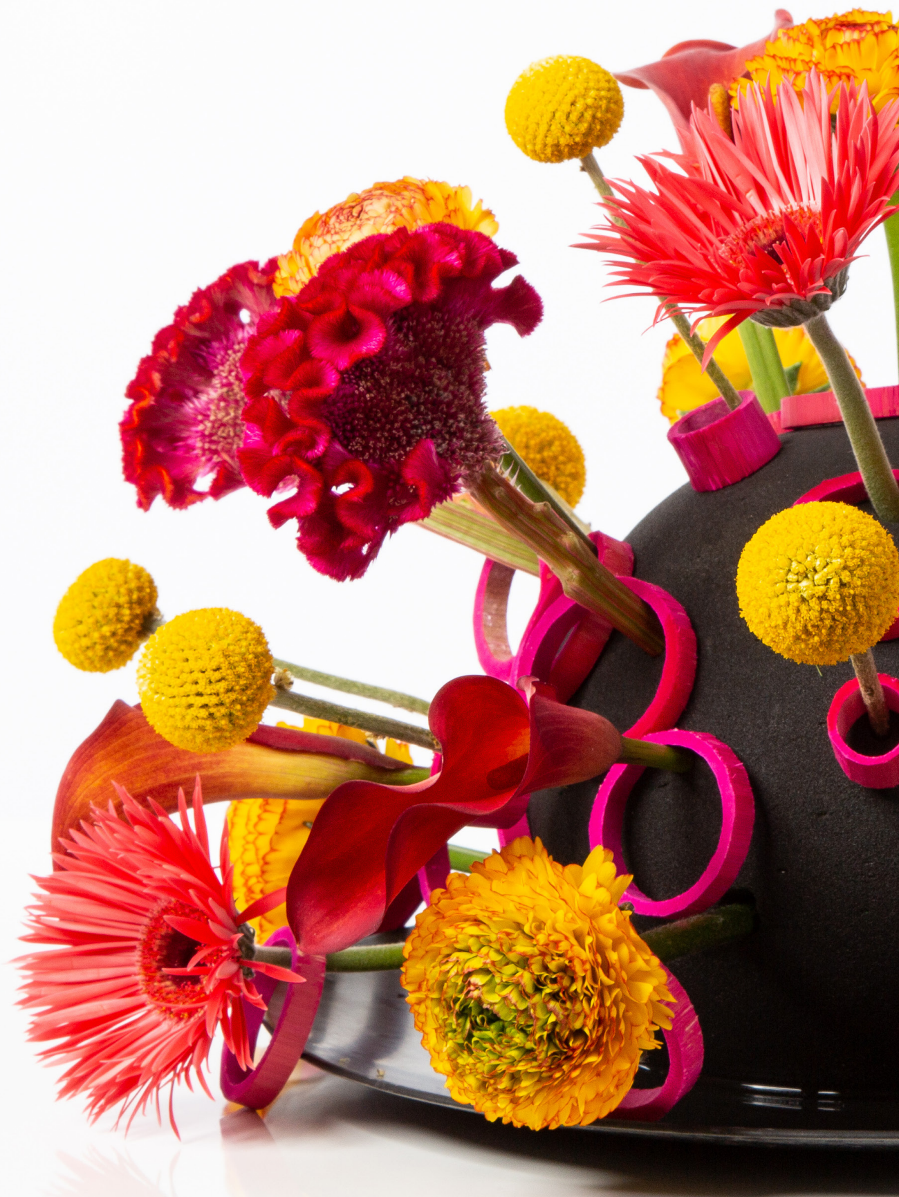
Arrangeur: Roos Van Unen Ondergrond: OASIS® BLACK IDEAL SPHERE