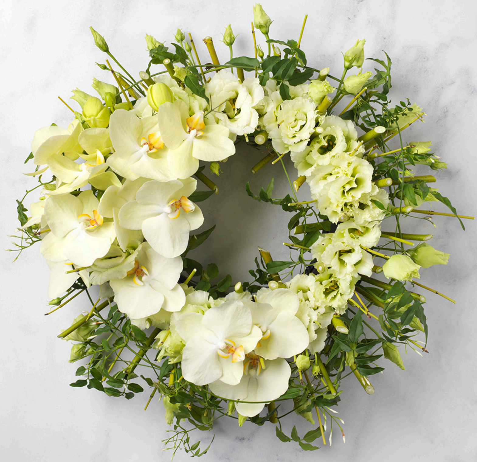
Arrangeur: Helen Jamieson Ondergrond: OASIS® BLACK NAYLORBASE® RING