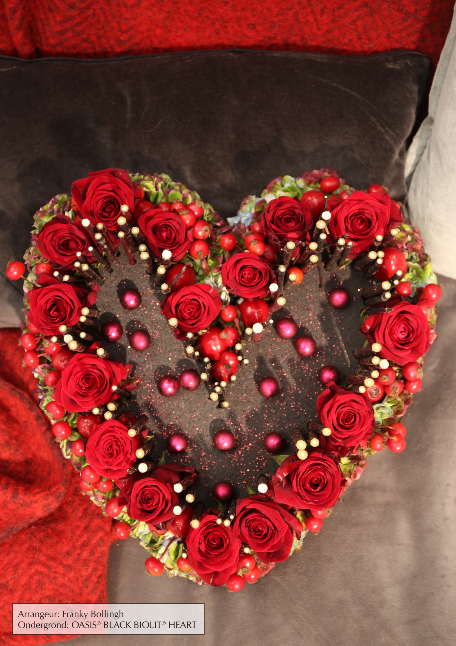
Arrangeur: Franky Bollingh Ondergrond: OASIS® BLACK BIOLIT® HEART