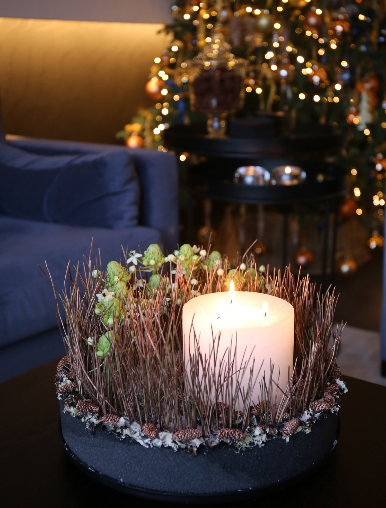
Arrangeur: Annick Mertens Ondergrond: OASIS® BLACK BIOLIT® PILLOW