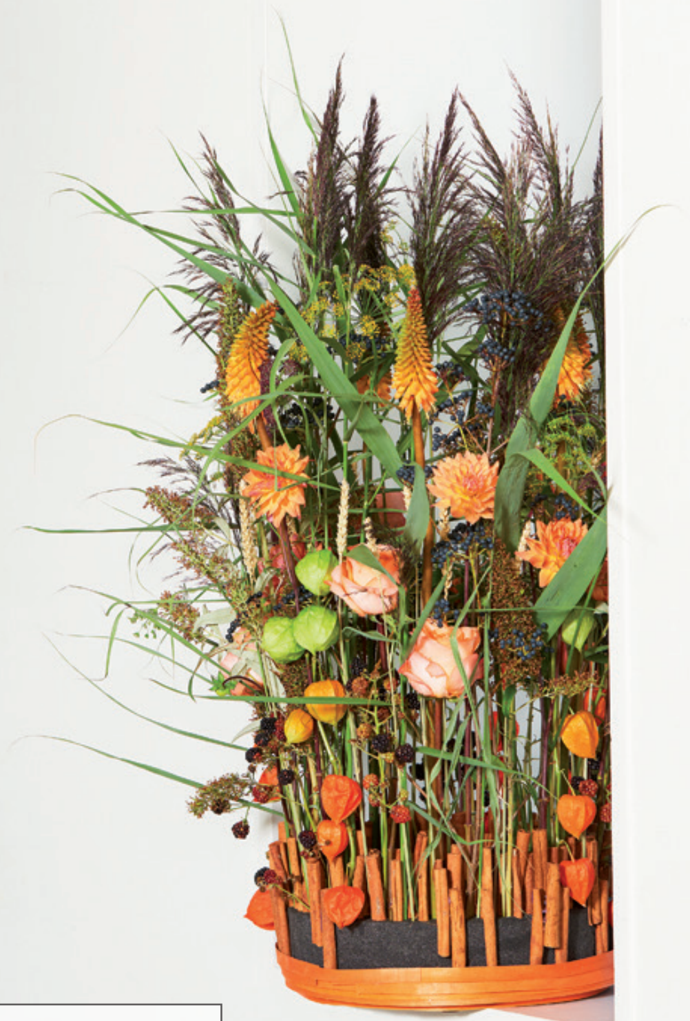
Arrangeur: DPK Ondergrond: OASIS® BLACK NAYLORBASE® RING