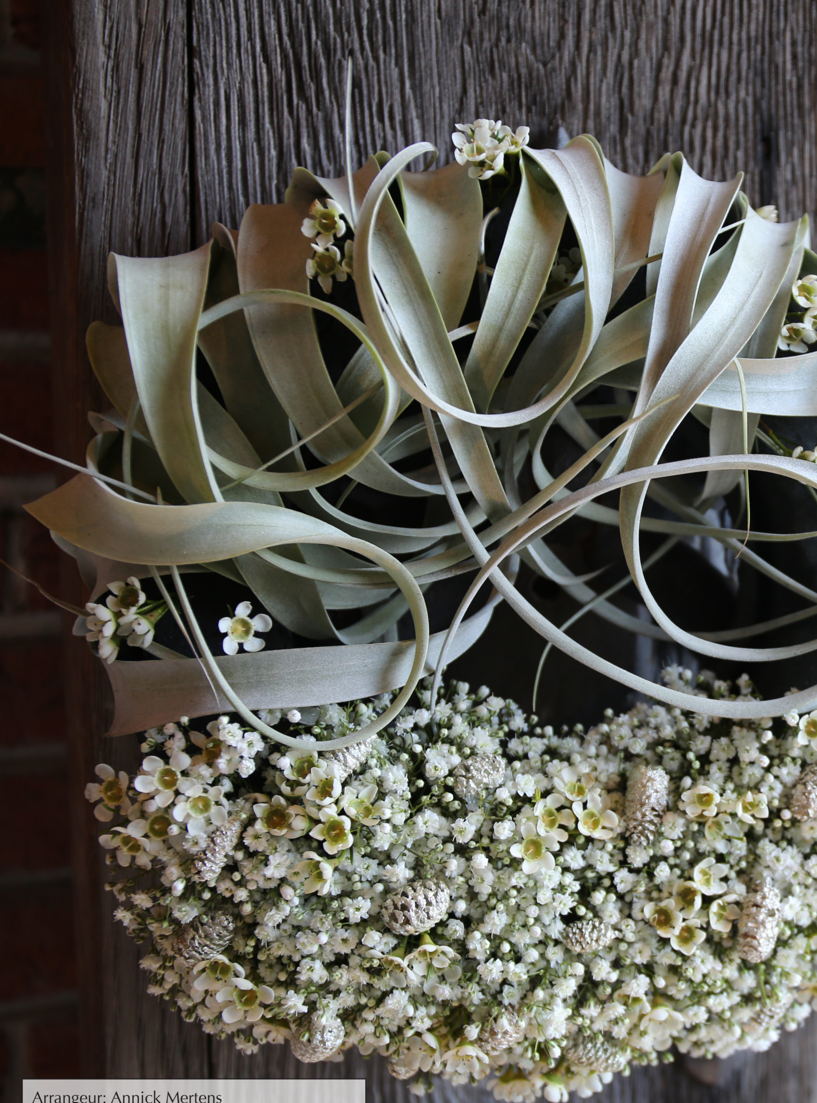
Arrangeur: Annick Mertens Ondergrond: OASIS® BLACK BIOLIT® RING