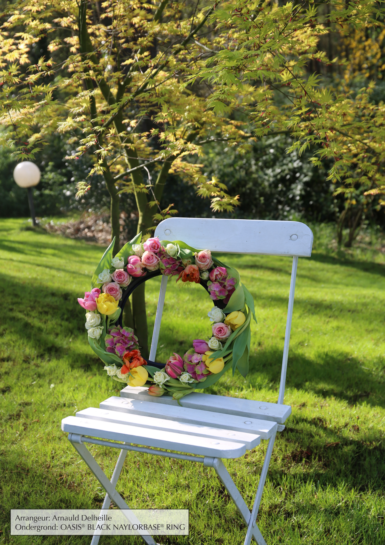
Arrangeur: Arnauld Delheille Ondergrond: OASIS® BLACK NAYLORBASE® RING