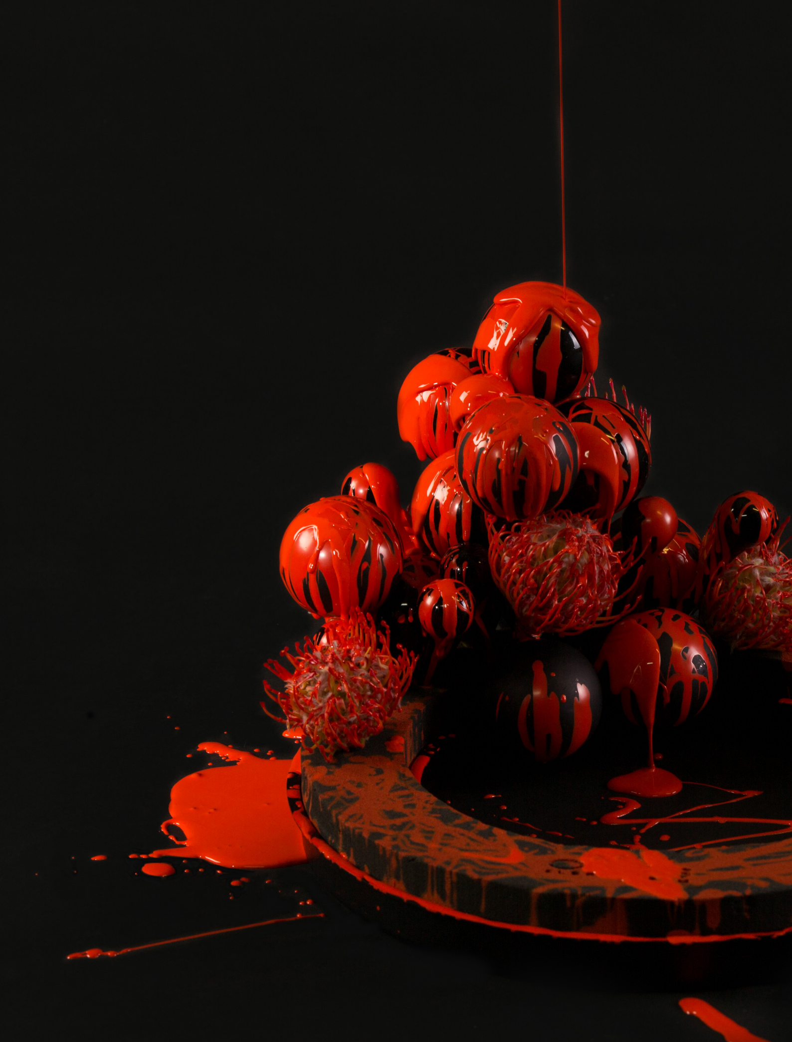
Arrangeur: Roos van Unen Ondergrond: OASIS® BLACK NAYLORBASE® RING