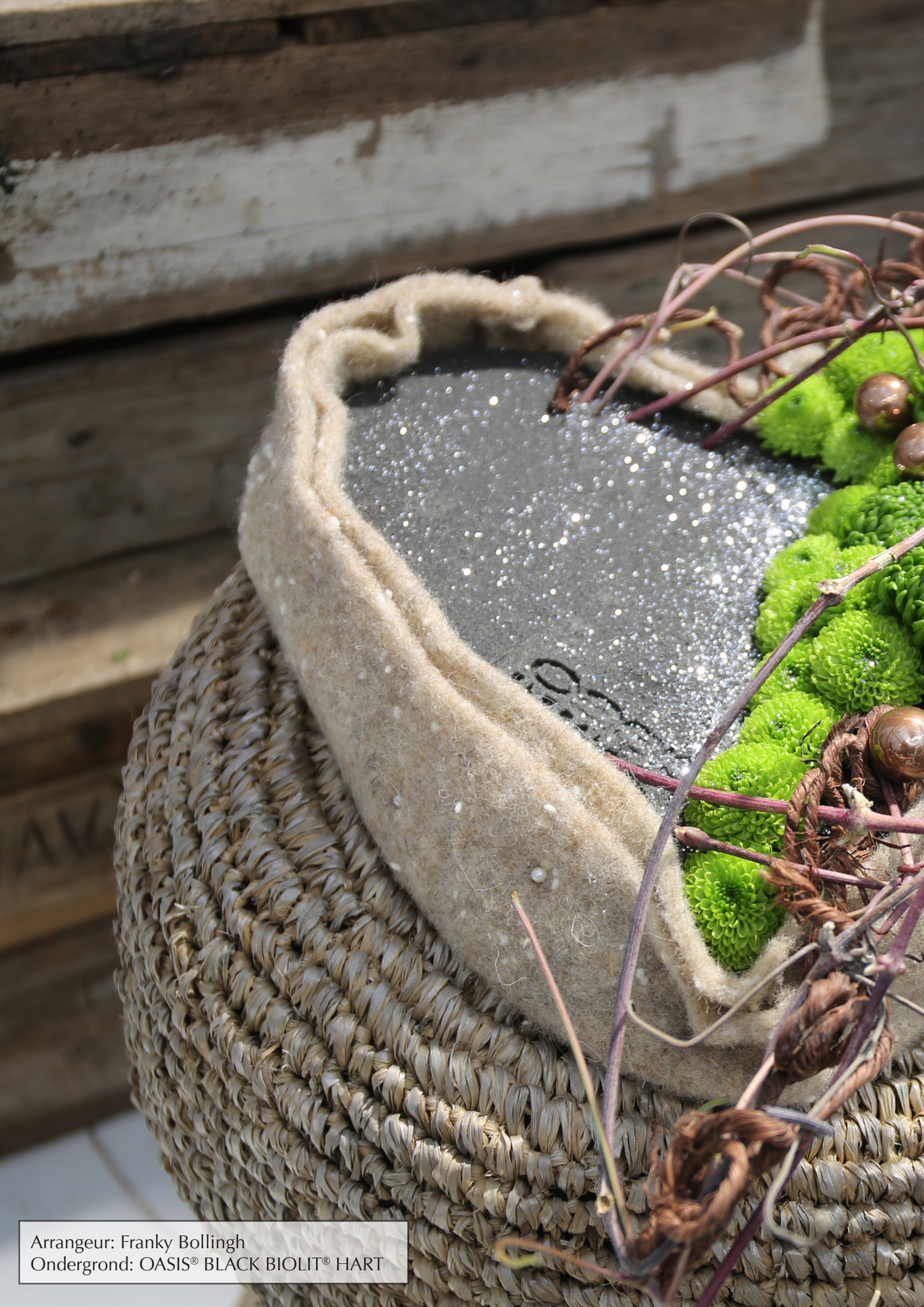
Arrangeur: Franky Bollingh Ondergrond: OASIS® BLACK BIOLIT® HART