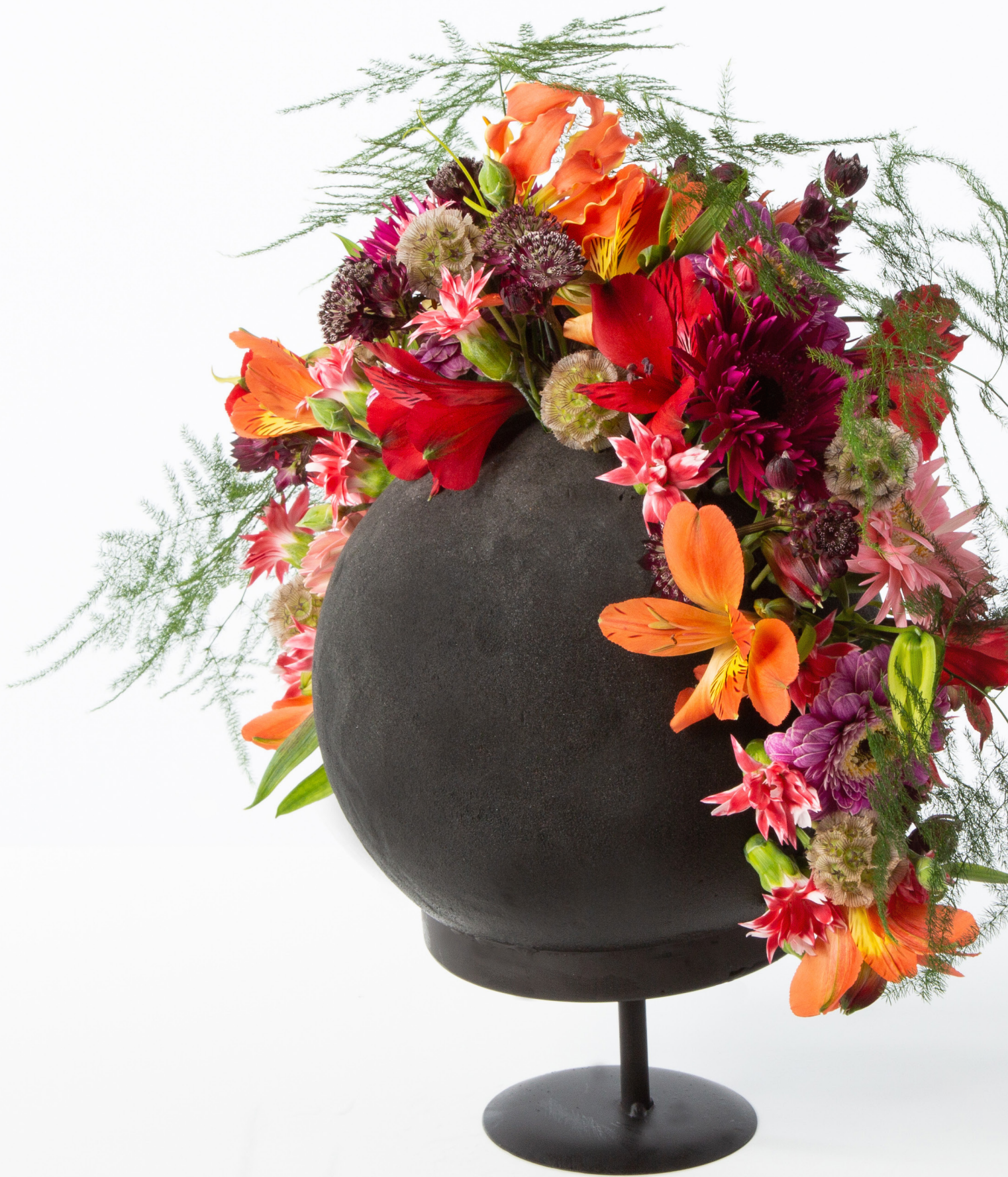
Arrangeur: Chantal Vollenbroek Ondergrond: OASIS® BLACK IDEAL SPHERE