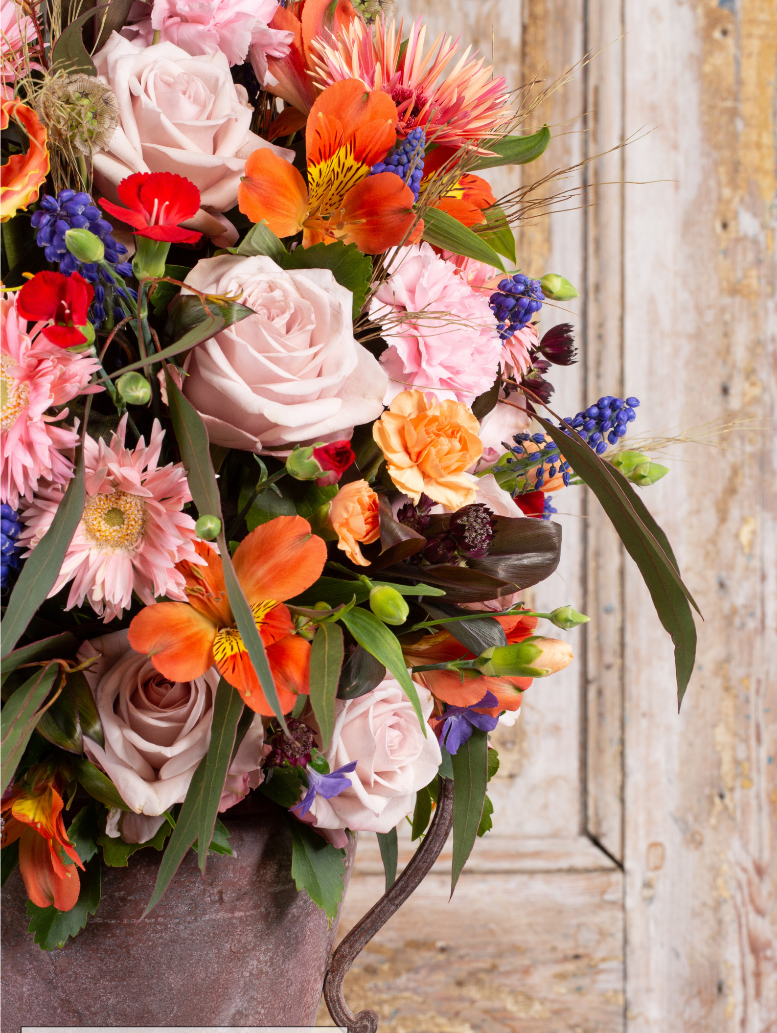
Arrangeur: Chantal Vollenbroek Ondergrond: OASIS® BLACK IDEAL BRICK