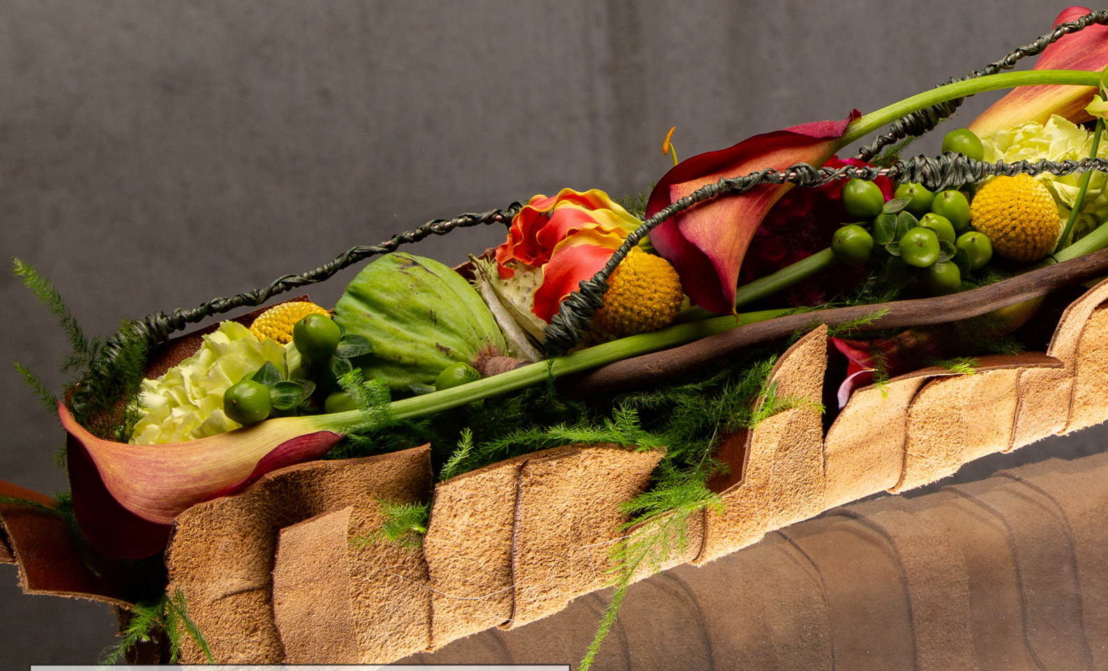
Arrangeur: Pim Van Den Akker Ondergrond: OASIS® BLACK BIOLIT® KRUIS