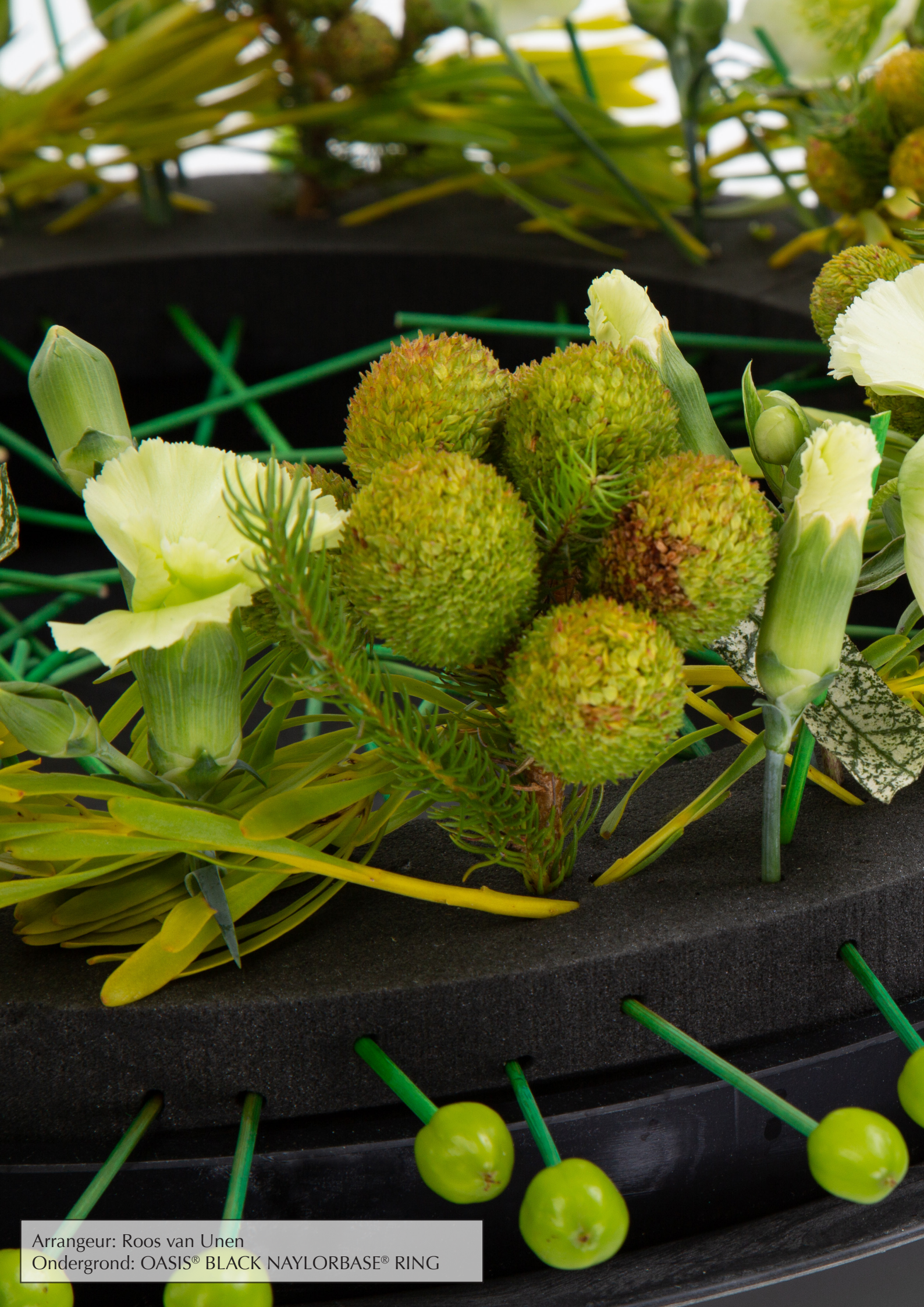
Arrangeur: Roos van Unen Ondergrond: OASIS® BLACK NAYLORBASE® RING