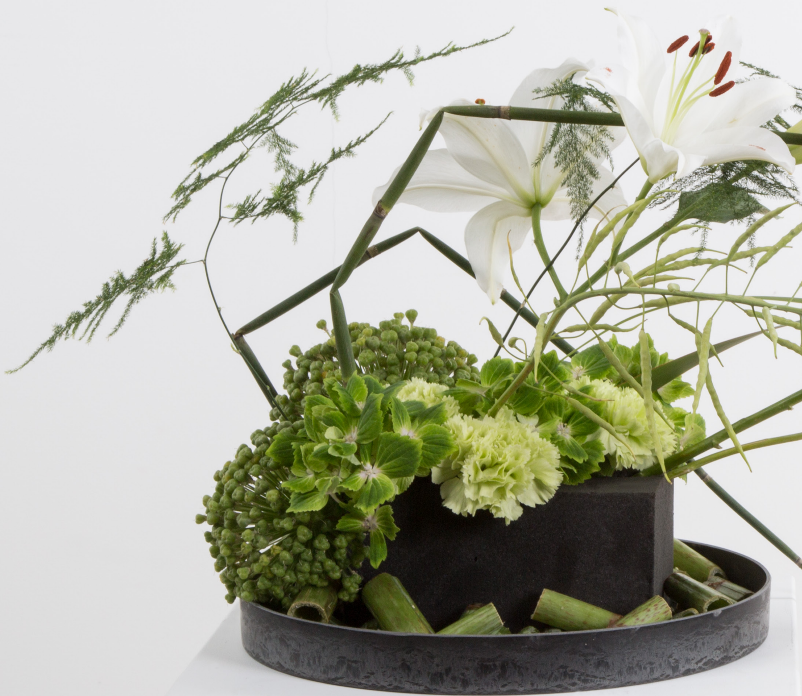
Arrangeur: Pim Van Den Akker Ondergrond: OASIS® BLACK IDEAL BRICK