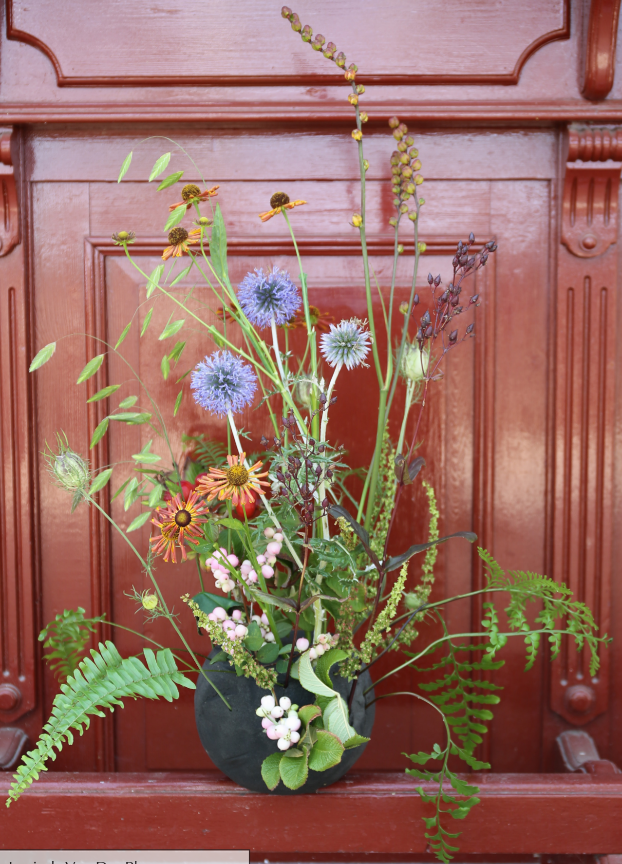
Arrangeur: Lucinda Van Der Ploeg Ondergrond: OASIS® BLACK IDEAL SPHERE