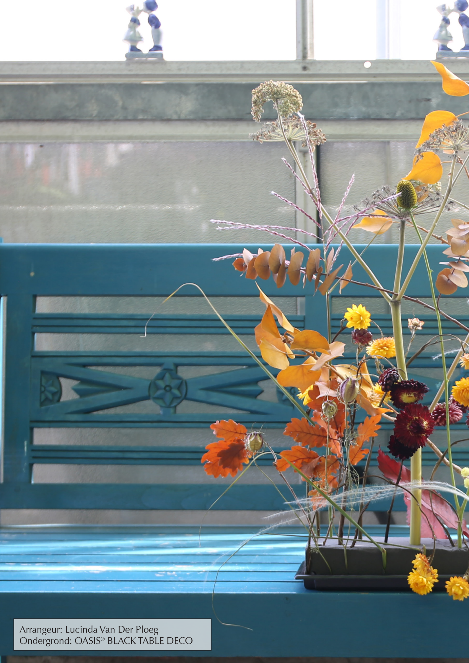
Arrangeur: Lucinda Van Der Ploeg Ondergrond: OASIS® BLACK TABLE DECO